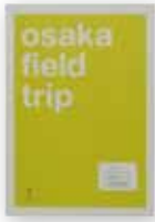
<osaka field trip>